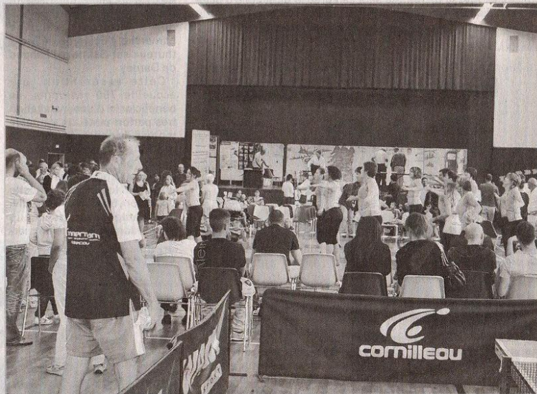
Les démonstrations se sont enchaînées tout au long de la journée.