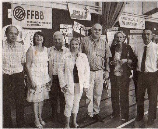
Des élus ravis de baigner dans l'ambiance bon enfant du Forum des sports et Cie.