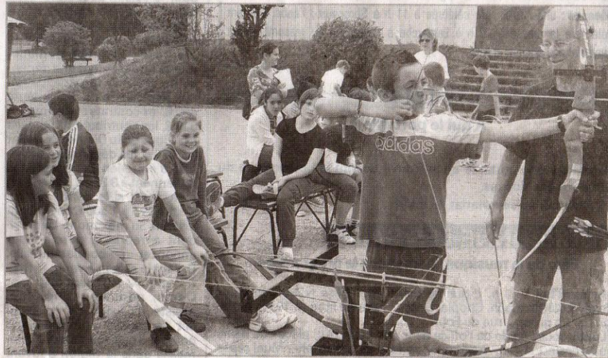
Les enfants de Beau-Joly, des écoles Bey, Brahy et Saint-Pierre-Fourrier ont multiplié les ateliers dans le cadre des neuvièmes Ecoliadés.