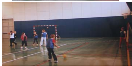
« Journée inter associations » du 1 er juillet 2007 »