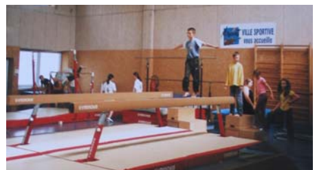
« Les Ecolades du 22 juin 2007 »

La Présidente de l'OMS, Pascale PIERROT-CRACCO.