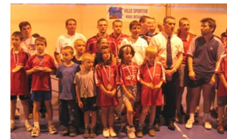
La photo de groupe du tournoi interne du 13 mai dernier

Hors compétition, notre section "loisir" vous attend, juste pour le plaisir de taper dans la balle, chaque mercredi de 18h30 à 19h30/20h00.