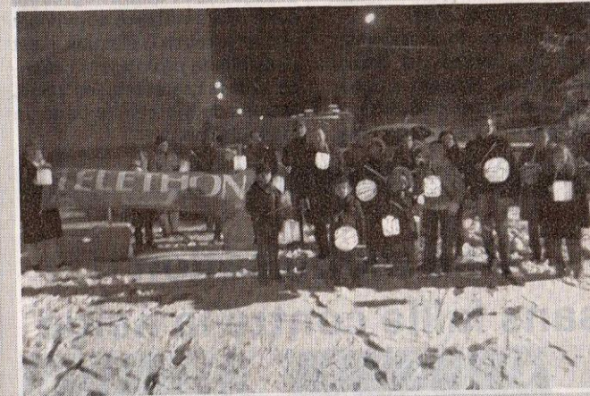
Les organisateurs du Téléthon ont bravé le froid pour animer leur stand place De-Gaulle.