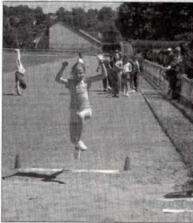
Déjà de l'allure dans l'envol de cette fillette qui a fait preuve d'une belle motivation.

bien une dynamique des Ecoliadés et j'en veux pour preuve le nombre croissant des participants qui s'affrontent chaque année, dans le plus pur esprit sportif et en toute convivialité... Il s'agit d'un vaste travail d'équipe associant les éducateurs municipaux, les associations sportives, les services techniques de la Ville, sans oublier notre généreux partenaire, le supermarché Cham-