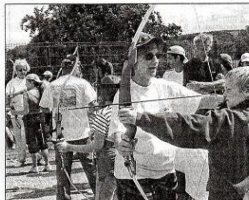
Le tir à l'arc est un sport qui demande un maximum de concentration.