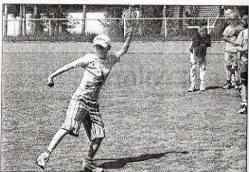
Répartis sur différents sites, les enfants se sont adonnés tout au long de la journée à plusieurs activités.