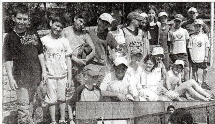
Quelque 217 enfants de CM1 et CM2 de la cité se sont retrouvés pour disputer dans la bonne humeur cette 5 e édition des Ecoliaades. Un moment de dévouement général toujours apprécié de tous.