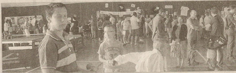
De la graine de champions pointait son nez à la manifestation.