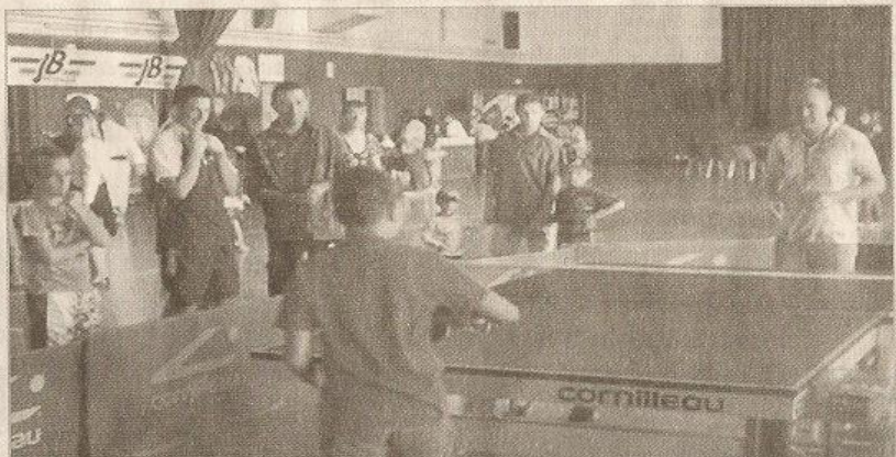
Les dirigeants du sport mirecourtien ont assisté à un défilé ininterrompu de futurs licenciés.