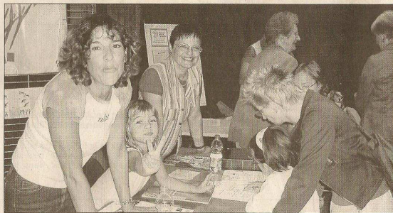
Les associations sportives ont réservé le meilleur accueil aux parents à l'occasion de cet après-midi.